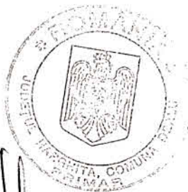
Bálint Szilárd viceprimar