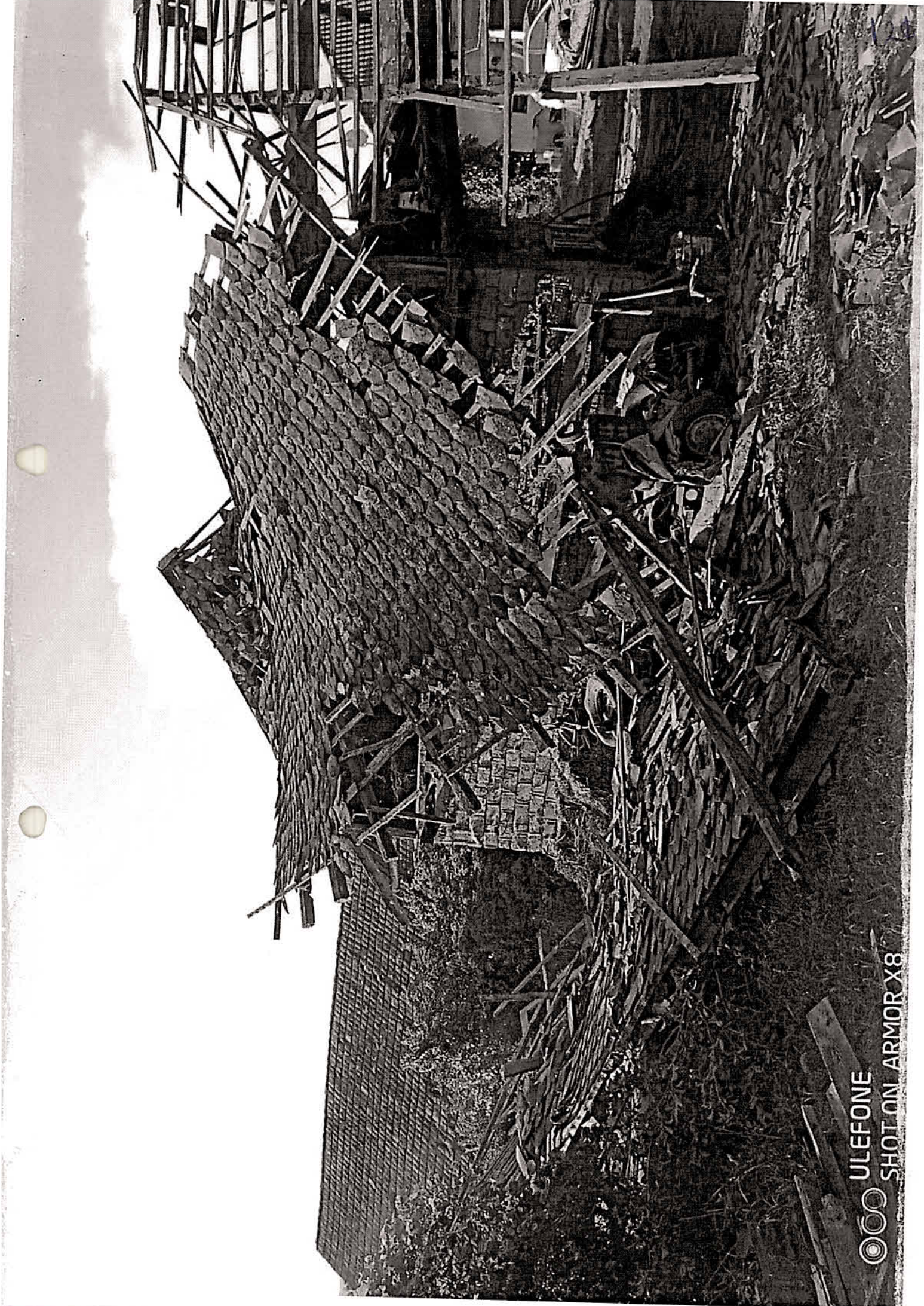
©©© ULEFONE SHOT ON ARMOR X8